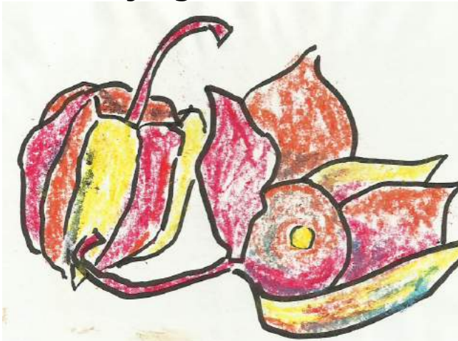
Ti Fens (tuin 20)

Vandaag heb ik niet gedaan wat ik zou moeten doen. Ik had het me heilig voorgenomen, maar het was zo mooi weer en soms scheen zelfs de zon. De mailtjes die ik nog moest versturen. Het artikel dat ik nog moest schrijven. De mensen die ik moest bellen. Het werk voor maandag dat voorbereid moest worden. Het huis dat schoongemaakt moest worden. Ik heb het niet gedaan. Ik stond met de dweil in mijn hand en ik heb hem losgelaten. Ik ben naar buiten gevluht, ik heb de fiets gepakt en ben naar de volkstuin gereden, op vijf minuten afstand van mijn huis. Sommige mensen zeggen: 'Een volkstuin? Zoveel mogelijk stenen in de tuin, betegelen dat ding. Nog meer werk dat niet afkomt, nog meer schuldgevoel over zaken die niet meer gedaan worden, uitgesteld, afgesteld.'